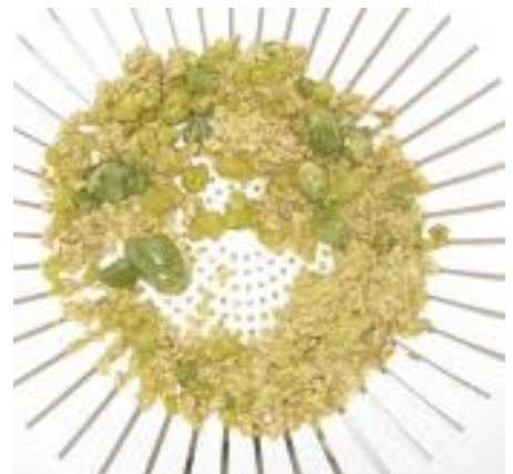
Gallen-, Leber- und Cholesterinsteine